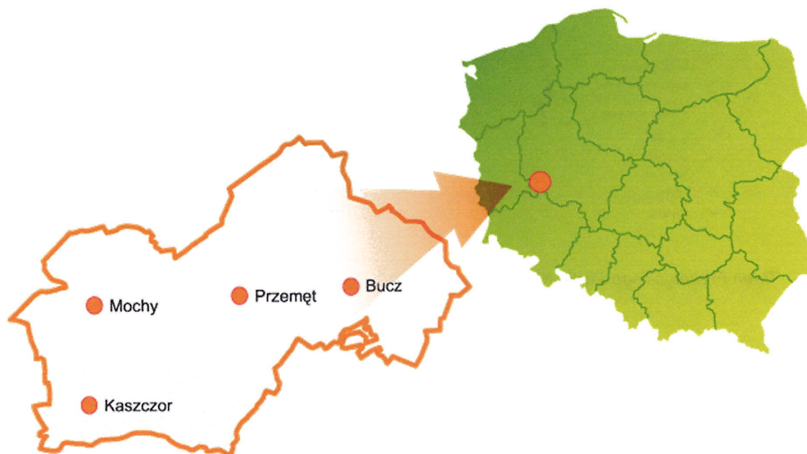
Położenie Gminy Przemęt

Teren Parku to wspaniałe miejsce do aktywnego wypoczynku. Na terenie gminy wyznaczone zostały turystyczne szlaki – piesze, rowerowe i konne. Liczne jeziora i kanały tworzą wspaniałe miejsce dla żeglarzy i kajakarzy. 1